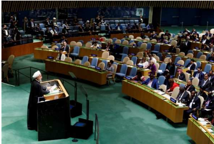
El presidente de Irán, Hasan Rohani, en su intervención ante la Asamblea General de la ONU.

Añadió, sin dar más detalles, que el objetivo de esta Coalición es la estabilidad, el progreso, el entendimiento mutuo y las relaciones pacíficas. La iniciativa incluye la cooperación en varios campos, el trabajo colectivo para la seguridad de la energía, la seguridad de la navegación, libre tránsito del petróleo y otros recursos dentro y fuera de los márgenes del estrecho de Ormuz, basándose en los principios de las Naciones Unidas, el respeto mutuo, el entendimiento, respeto a la soberanía e integridad territorial de los países y la inviolabilidad de las fronteras. Se fundamenta en dos principios: “no agresión y no injerencia en los asuntos domésticos”. También ha destacado la necesaria “participación de las Naciones Unidas como paraguas de la Coalición de la Esperanza”.