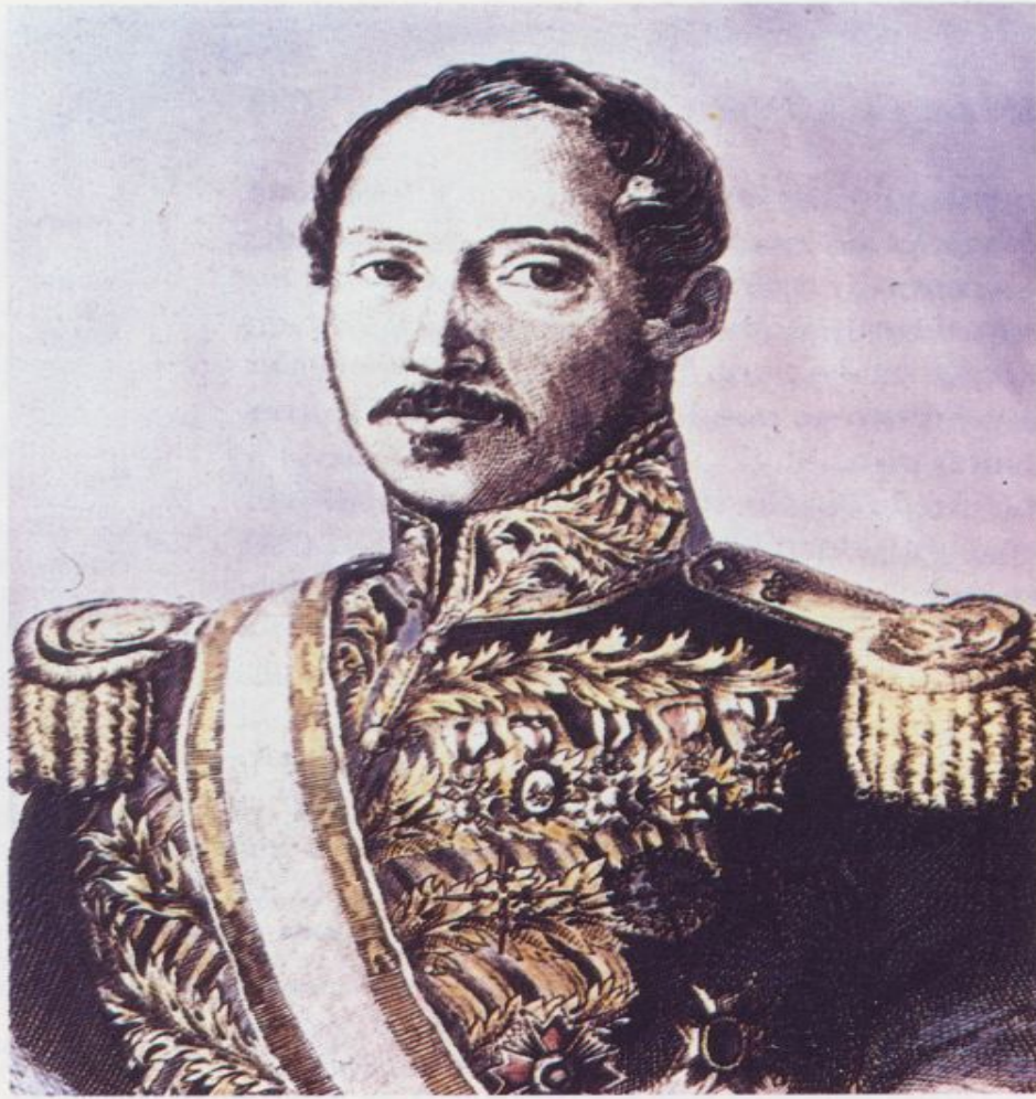
General Serrano Domínguez, principal artífice del triunfo sobre la rebelión del 22 de junio.

cos y la indisciplina afloran, afluyendo entonces la desorganización y como consecuencia inmediata el desánimo cunde entre quien la sufre. Y esto fue justamente lo que les ocurrió a los sublevados. Abandonada a su suerte, la sublevación civil no tuvo ni en Pierrad, ni en Contreras, ni en el capitán Hidalgo (49) —militares encargados de coordinar las acciones civiles— los puntales suficientes para imponer la necesaria disciplina y, por tanto, combatir con éxito a las fuerzas leales, más disciplinadas y mejor dirigidas: el resultado no podía ser otro que terminar por sucumbir. Por tanto, no resulta difícil atribuir las causas del fracaso de la sublevación solamente a la precipitación de los sargentos, inhibiendo así a Prim en el último momento, sino acaso también a la indisciplina y desorganización de que hicieron gala en el teatro de operaciones la combinación de fuerzas rebeldes, convirtiéndose en presa fácil de las tropas al servicio del gobierno. En todo caso, antes de quedar sofocada, la lucha entablada dejó tras sí un rastro de sangre cuyas cifras hablan por sí solas de la dureza de los combates: 80 muertos y 600 heridos (50), de los que algunos fueron guardias civiles, como más adelante veremos.