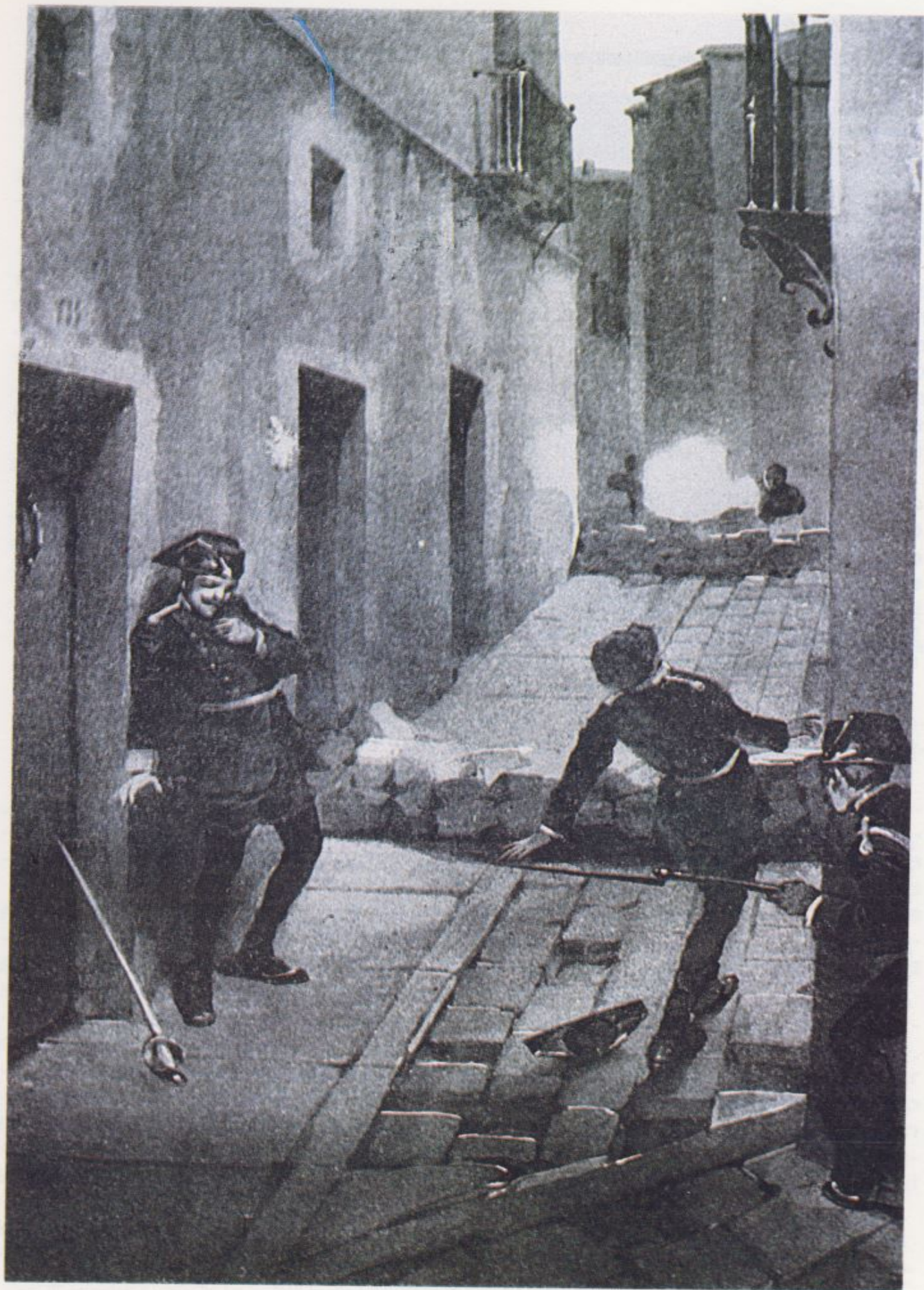
La Guardia Civil en las barricadas de la calle la Luna, donde soportaría estoicamente la violencia revolucionaria del 22 de junio de 1866.