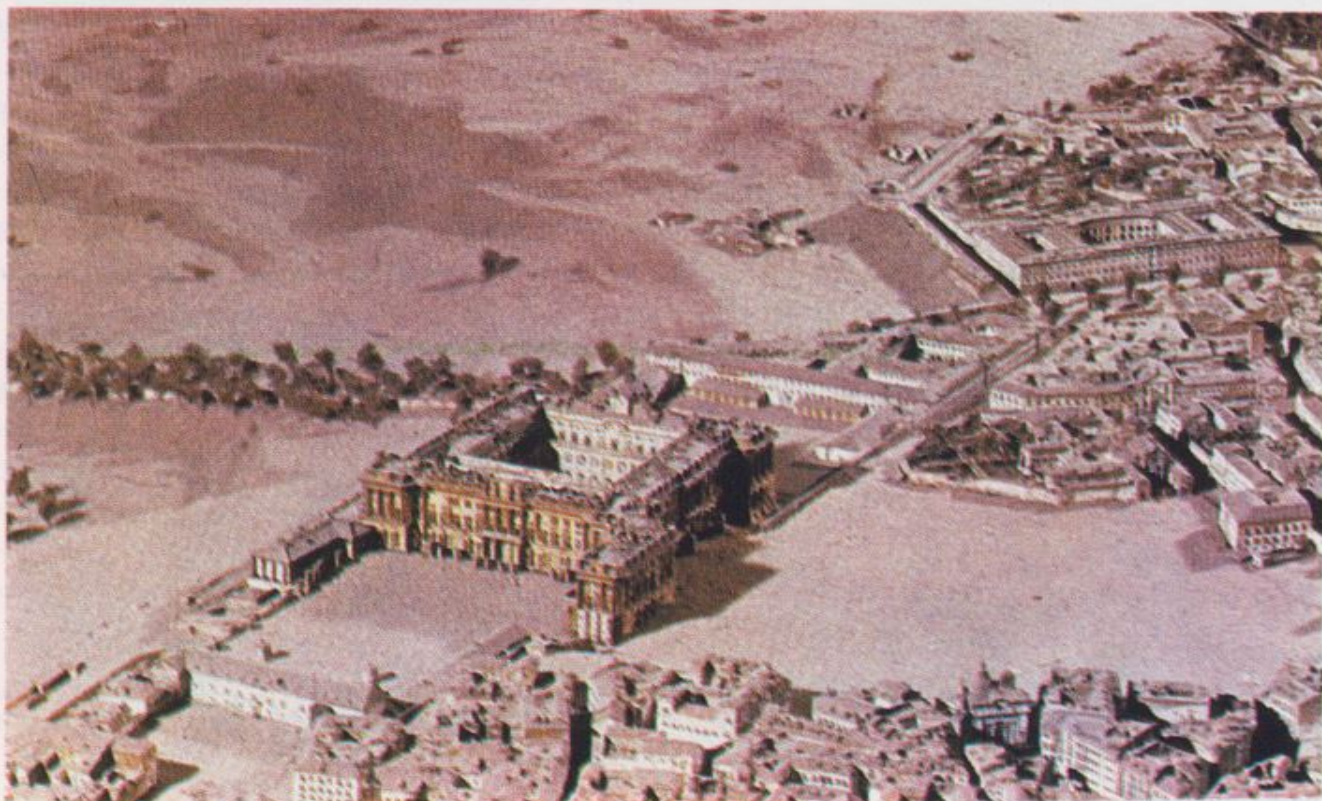
Maqueta del cuartel de San Gil, emplazado en la Plaza de España, tal como era en los años sesenta del siglo XIX.