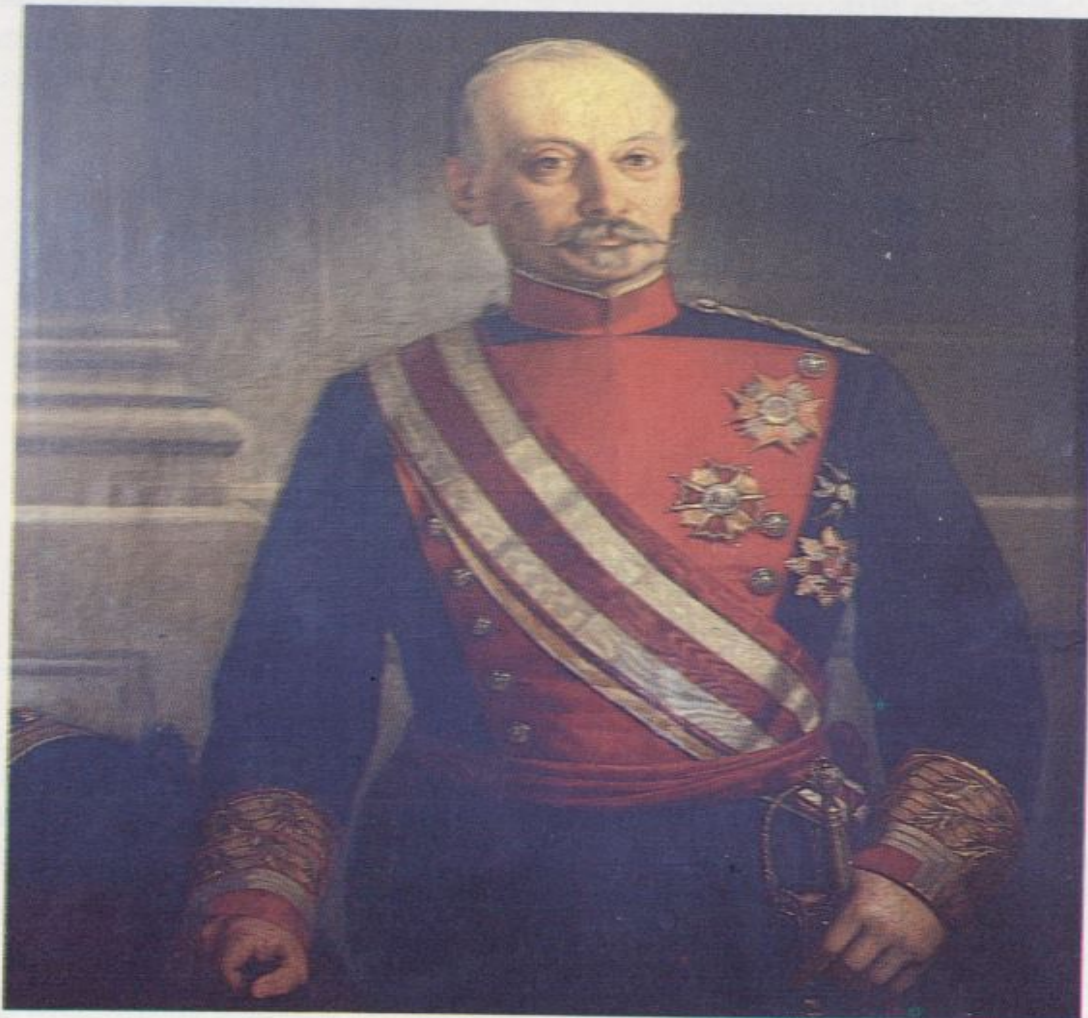
General Serrano Bedoya, Director General del Cuerpo durante la rebelión del cuartel de San Gil.

Unos murieron en la calle de la Luna, otros en distintos puntos de la capital, pero todos por la misma causa y en acto de servicio. Naturalmente