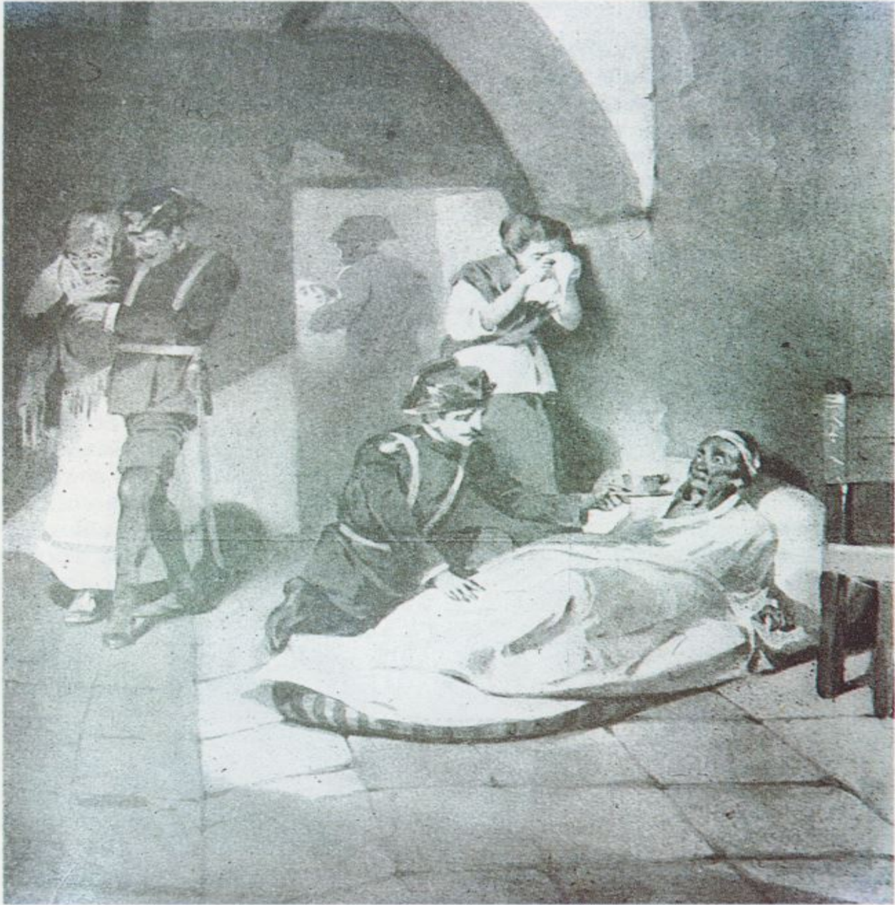
La Guardia Civil se distinguió en servicios de beneficencia durante la letal epidemia de cólera que azotó Madrid en 1865. (Grabado de la época).

gresistas con el retraimiento y, por tanto, al obligar a Prim a «empuñar los fusiles» (15) y hacer de este modo inútiles los actos de tolerancia de O'Donnell para lograr torcer el camino de la revolución, mas al contrario, sí sirvieron «para facilitarle la organización de sus fuerzas de choque, abriendo clubs y comités republicanos en que se preparaba la próxima batalla contra las instituciones del orden doctrinal» (16).