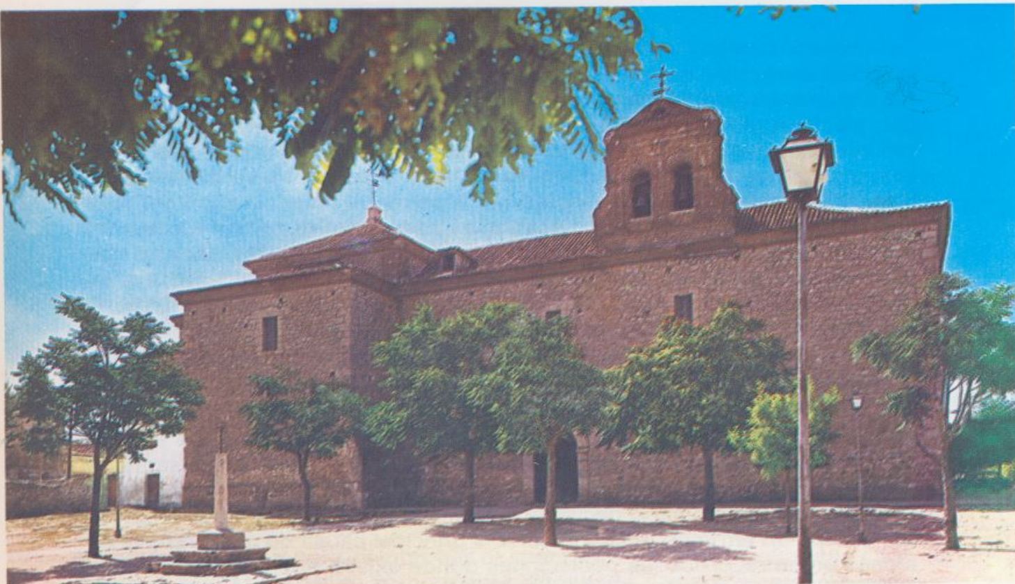
Santuario de Nuestra Señora de la Victoria en Villarejo de Salvanés, escenario de la asonada de Prim en enero de 1866.