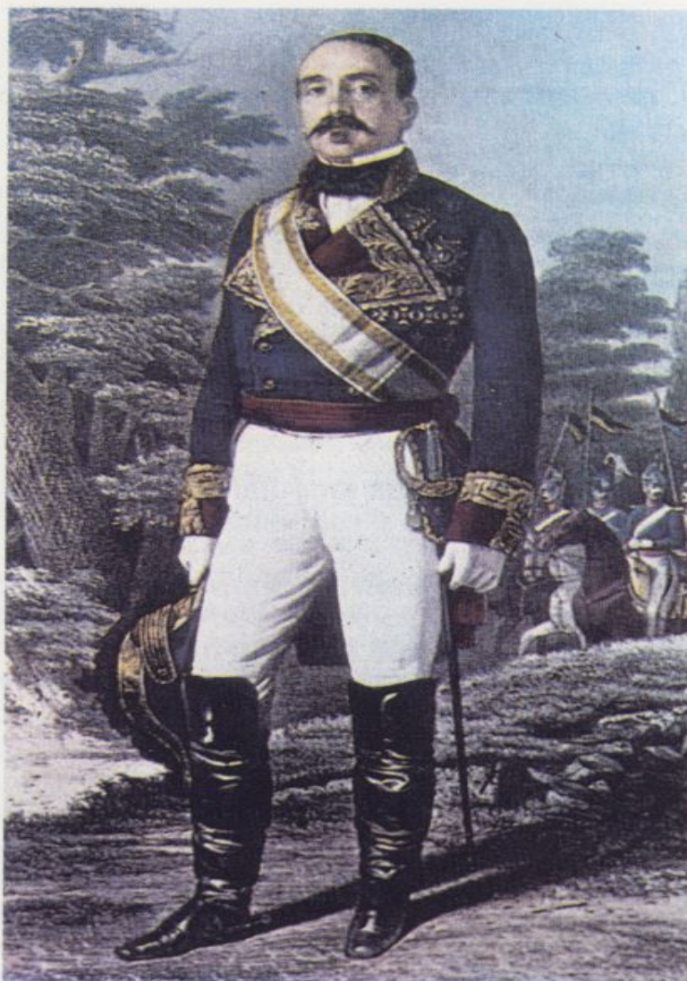
General Pierrad, acólito de Prim. Dirigió sin acierto la sublevación militar del 22 de junio de 1866.

ta y el Fomento de las Artes», decía una noticia del periódico «La Esperanza» en día 5 de enero. Inmediatamente se procedió a votar una nueva ley de prensa, más restrictiva que la de Nocedal, de triste memoria, que hasta el propio Posada Herrera reputó de «pecado» (30). En el orden personal la represión propició el destierro del general Pierrad, «conducido preso y custodiado por un oficial y dos guardias civiles» (31), y lo que sería peor: algunos sargentos a los que se les había demostrado su connivencia con los pronunciados fueron fusilados en Madrid, en una acción del Gobierno que contribuiría a ahondar más la sima existente entre esta clase del Ejército y el régimen isabelino a raíz de la marginación de que estaban siendo objeto por diversas disposiciones de los sucesivos gobiernos de S.M., encaminadas a cerrar sus posibilidades de ascenso. Ahora, al proceder al fusilamiento de estos sargentos se estaba fomentando la animadversión hasta límites peligrosos, tanto que estuvo a punto de provocar un suicida levantamiento, precedente del que meses más tarde iba a producirse: