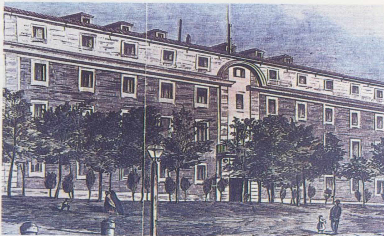
Fachada del cuartel de Artillería de San Gil. Sus sargentos se erigieron en protagonistas de la asonada del 22 de junio. En su interior tendrían lugar escenas de gran violencia.

char luego a Zaragoza, y desde este punto a Madrid, donde la Junta secundaria el movimiento con las fuerzas ya comprometidas de esta guarnición» (41).