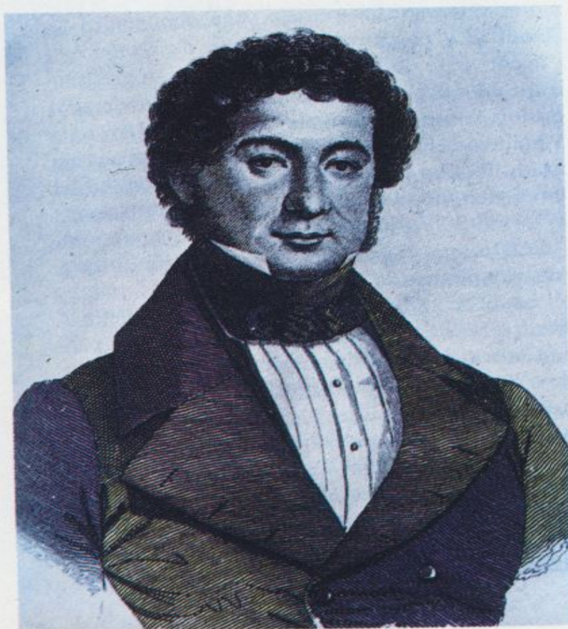
Salustiano Olózaga, preboste progresista, a quien se considera principal responsable de la continuación del retraimiento de su partido durante la crisis monárquica.

gresistas con diversas alternativas. El Marqués de los Castillejos, por ejemplo, no era partidario de continuar con el absentismo, sobre todo después de haber recibido él mismo en persona la promesa de O'Donnell de celebrar elecciones libres y contar con los progresistas para el futuro. Pero la mayoría del partido, sus masas concretamente, no parecían querer alejarse de la senda revolucionaria, y Olózaga lo comprendió así cuando en sorprendente media vuelta adoptó la conducta de abogar de forma pertinaz por el