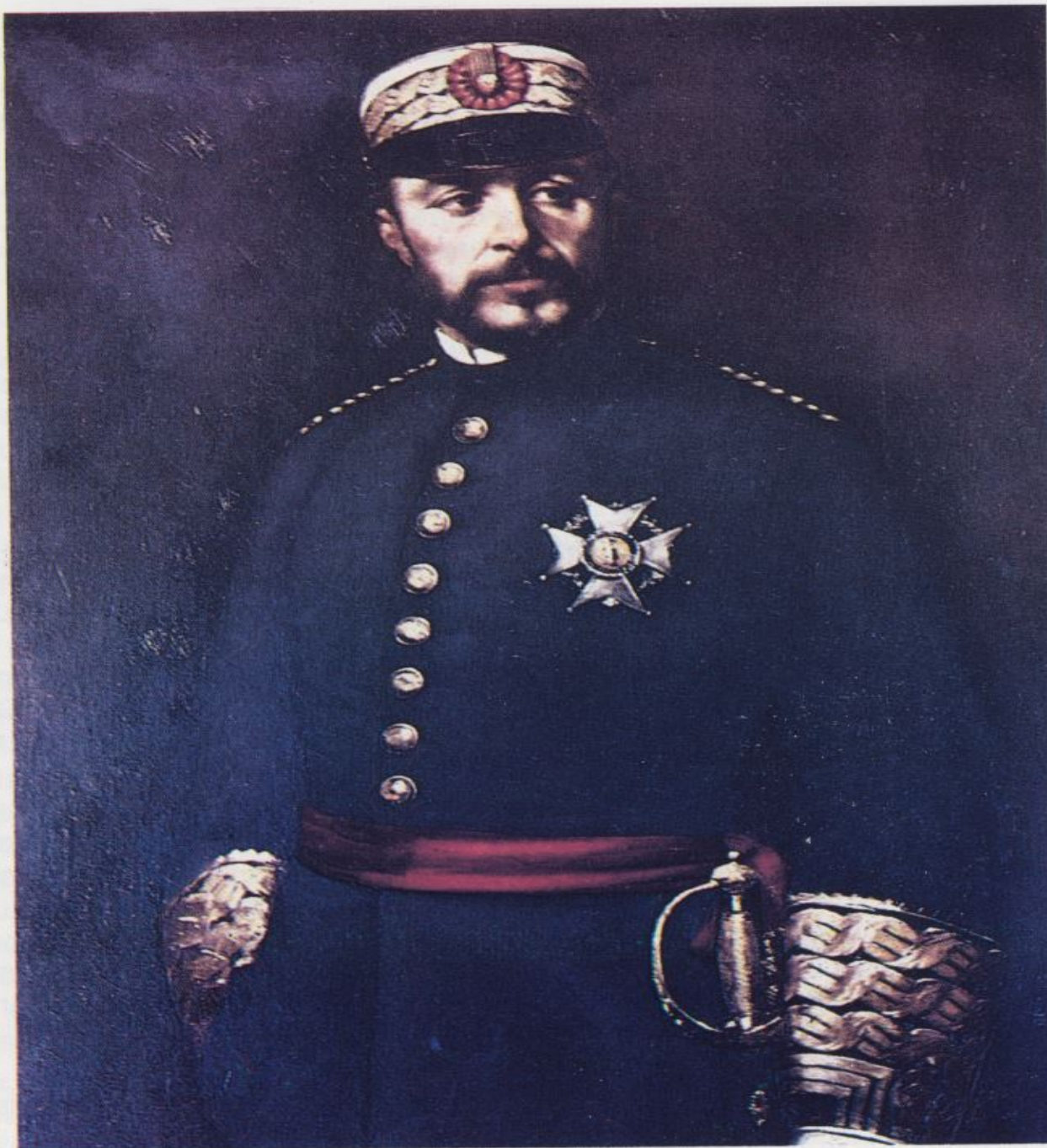
General Prim, indiscutible líder de los progresistas, quien puso todo su empeño en el derribo de la monarquía isabelina.

Con fecha 17 de enero del año que nos ocupa, el periódico «La Esperanza» nos da cuenta de la persecución a través de este telegrama: Trujillo 13 de enero (ocho y diez minutos de la noche). El Subinspector de telégrafos al Ministro de la Guerra.