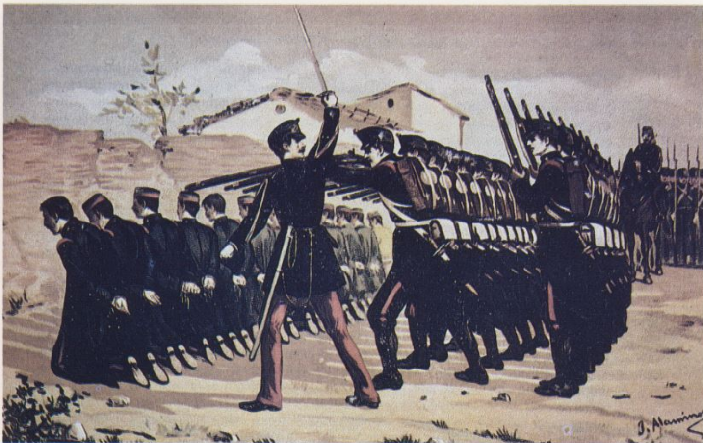
Fusilamiento de los sargentos comprometidos en la rebelión del cuartel de San Gil.

Podemos concluir, pues, que los acontecimientos del 22 de junio marcaron el punto de inflexión en la crisis del régimen isabelino. Una crisis que empezó fraguándose por sus propias contradicciones internas; que se agravó a raíz de los sucesos de la noche de San Daniel o las sublevaciones de Villarejo y del San Gil al desencadenar una amplia repulsa popular que alcanzó a la propia reina, cada vez menos respetada; y que terminaría por fagocitarlo cuando O'Donnell y Narváez trocaron la escena política por el lecho mortuario. Irreversible ya el proceso de destrucción del régimen cuando González Bravo accedió al poder, el pronunciamiento de la bahía de Cádiz al grito de ¡Viva España con honra!, no hizo más que consolidar la Revolución de septiembre: «Una brusca sacudida en la historia del siglo XIX español, cuyos efectos se dejaron sentir ampliamente en toda la geografía del país», según acertada definición de María Victoria López Cordón (58).