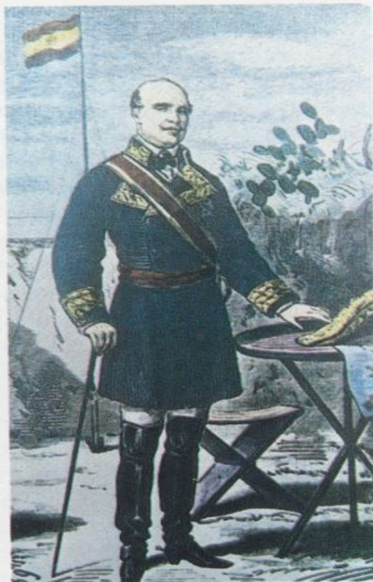
General O'Donnell. A su vuelta al poder intentó por todos los medios salvar la monarquía isabelina.