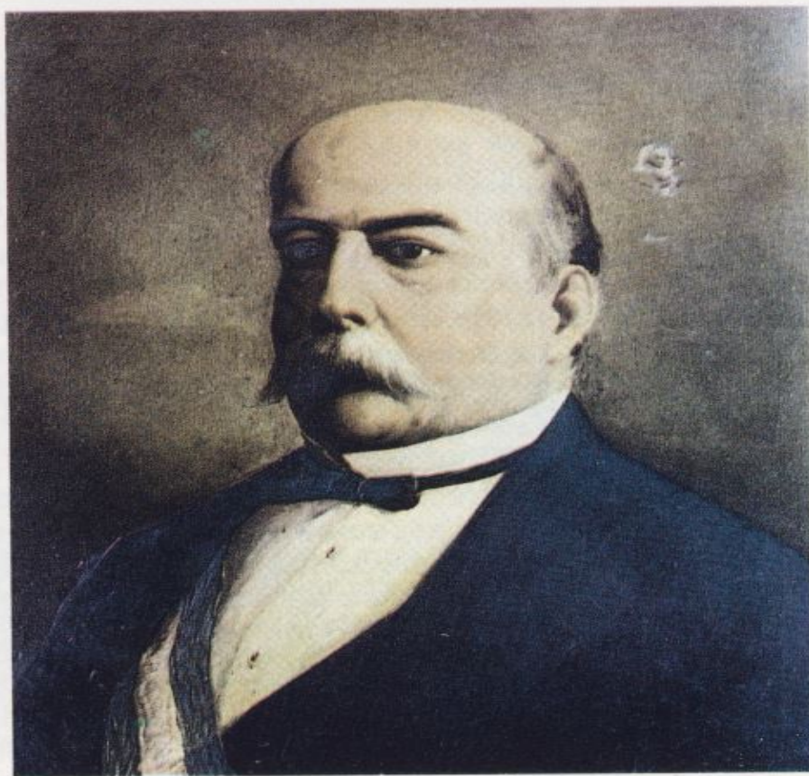
González Bravo, ministro de la Gobernación el 10 de abril de 1865. Fue quien ordenó disolver la algarada estudiantil.

na, era como suele ocurrir en estos casos, más un ataque contra el Gobierno, incapaz, por otra parte, de hacer frente al vendaval de protestas de que estaba siendo objeto desde varios frentes.