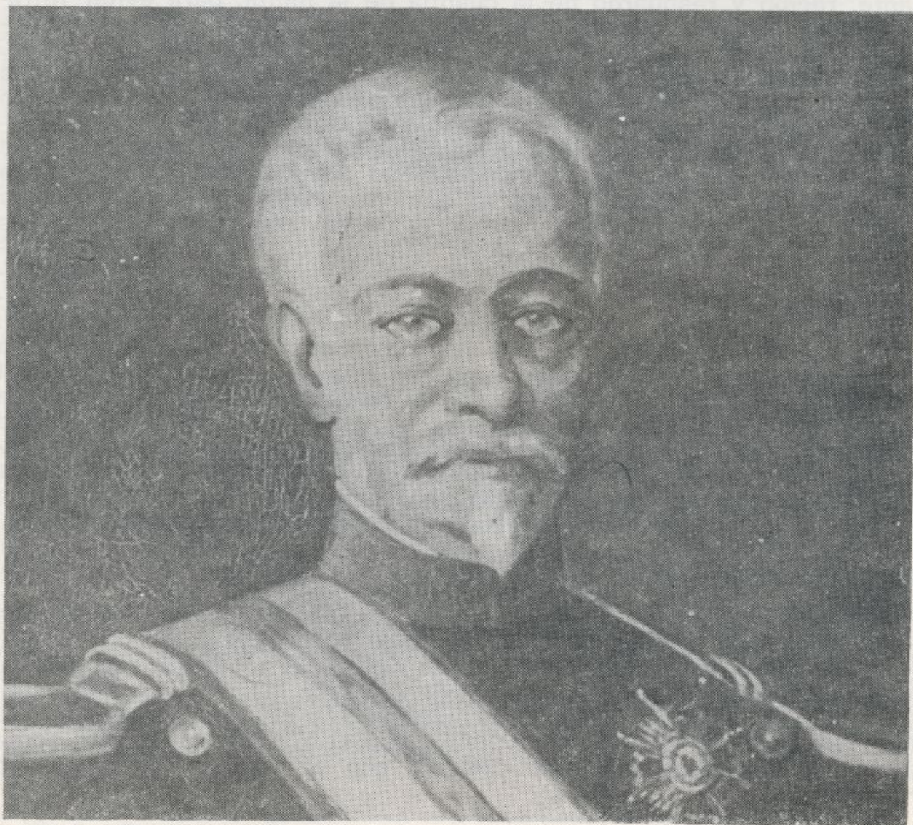
Don Francisco Javier Girón, Duque de Ahumada

«Se prohíbe a todas las autoridades civiles, militares, eclesiásticas o de cualquier otra clase imponer ni recaudar multas en metálico. Las que impongan gubernativamente penas pecuniarias de este género lo harán exigiendo al multado la presentación del pliego o pliegos equiva-