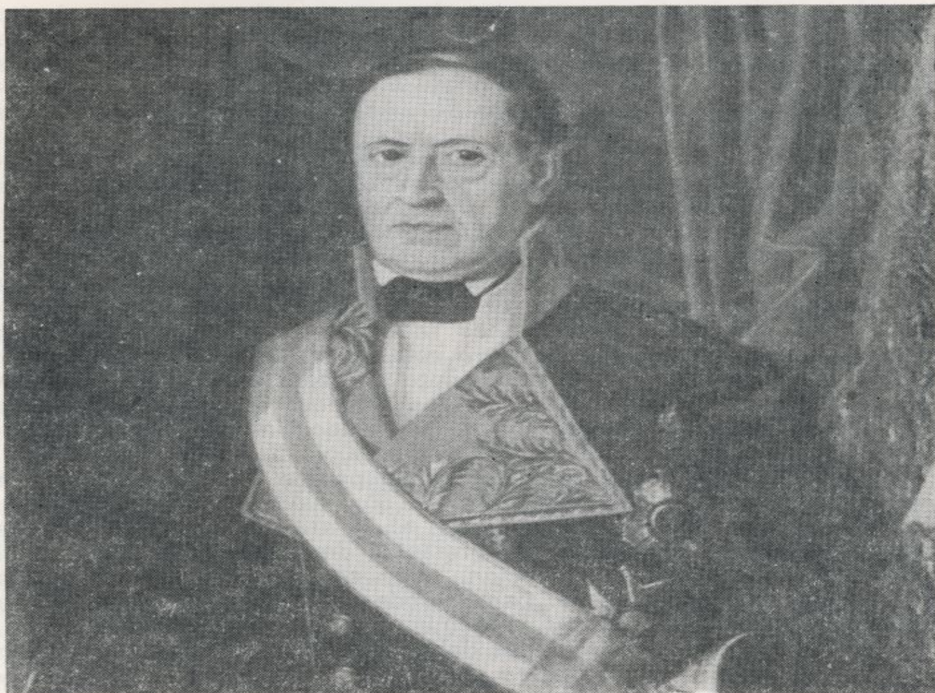
Don Facundo Infante, segundo Inspector General del Cuerpo

cuyo envío a la superioridad empezaría en el mismo enero (27). El 12 de agosto se precisa aún más el contenido de estos documentos, al ordenarse que en los estados mensuales y trimestrales del Fondo de Hombres se especifique por Compañías «la existencia que debe tener por los descuentos hechos a los individuos desde la creación de este fondo, expresando la que cada Compañía tenía en fin del mes anterior y aumentando la entrada que ha tenido en el mes, después de deducido lo que haya salido para el abono de los licenciados, y reposición de prendas, resultará la suma de las dos cantidades y la existencia que para 1.º del mes entrante» (28).